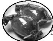
この「イカめし」美味しそうですよ？