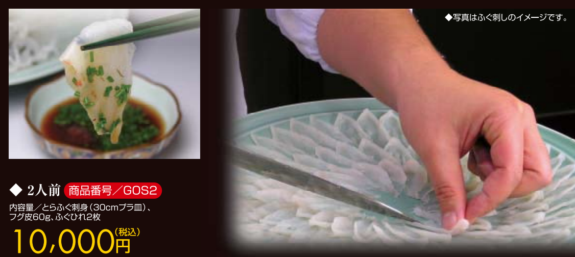
◆写真はふく刺しのイメージです。

鮮度の良い「とらふぐ」ならではのシャッキリとした歯応え、噛みしめるたび、じわりと広がる淡白な旨み。熟練した職人が仕上げる最高の味をどうぞご堪能ください。